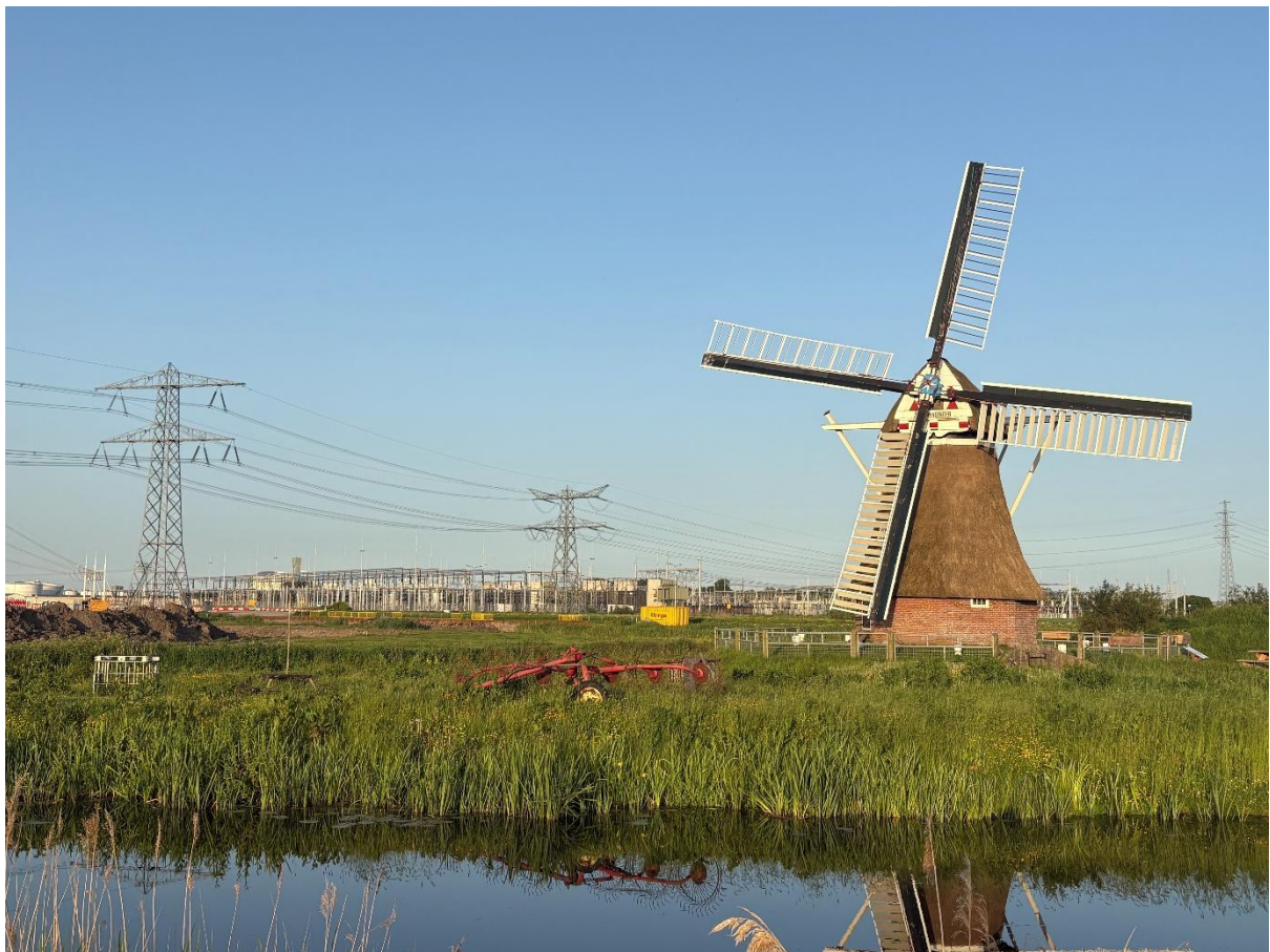
Beeld 3 De Zuidwendinger met op de achtergrond het nieuwe datacenter van Google

De weidsheid en de openheid van een groot deel van het Groninger landschap, of in specifiekere zin het 'molenlandschap' zoals omschreven, is een karakteristiek kenmerk van de provincie, maar feit is dat het in toenemende mate onder druk staat. Voor de molens vormt de aantasting van de weidsheid een bedreiging. Zo blijken 'verbossing' op meerdere plekken en (hoge) bebouwing steeds vaker problemen op te leveren voor molens, zeker wanneer ze in een meer dorpse of stedelijke omgeving staan. Maar ook (kleinschalige) nieuwbouwprojecten buiten de bebouwde kom of de aanleg van industrieterreinen kunnen problematisch zijn voor molens.