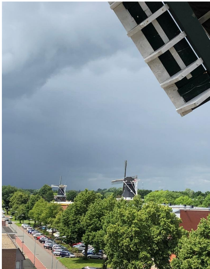
Beeld 2 molens Dijkstra en Berg in Winschoten, gezien vanaf molen Edens

Industriemolens zijn molens die breed inzetbaar zijn, onder meer voor graan malen, graan pellen, hout zagen, olie slaan en papier maken. Oliemolens en papiermolens zijn niet meer binnen de grenzen van de provincie Groningen te vinden, maar koren-, pel- en zaagmolens wel. Vrijwel alle korenmolens zijn nog 'maalvaardig', dat wil zeggen dat met de maalstenen nog steeds op windkracht graan gemalen