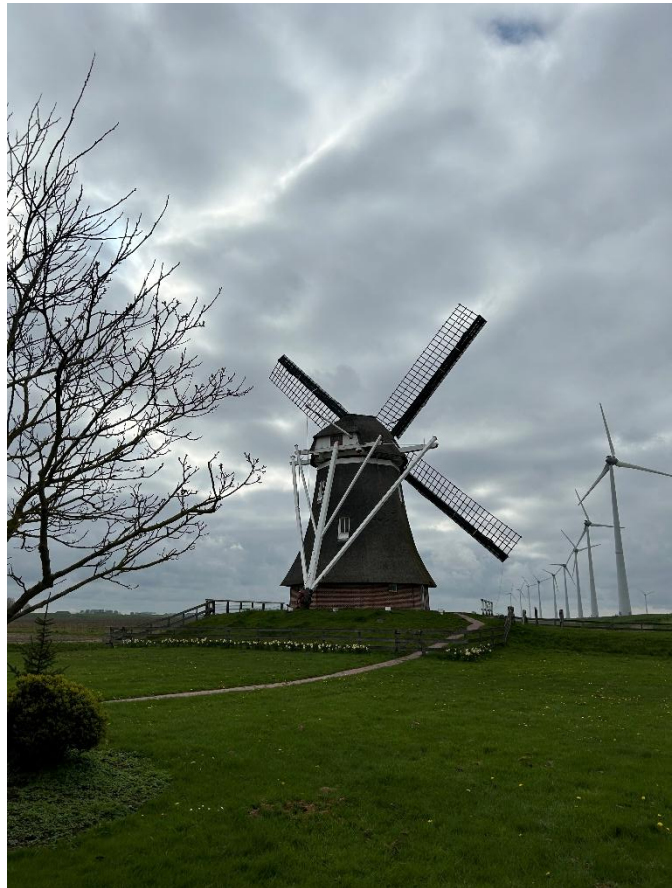
Beeld 4 poldermolen De Goliath in de Eemshaven, oude en nieuwe molens in één iconisch beeld