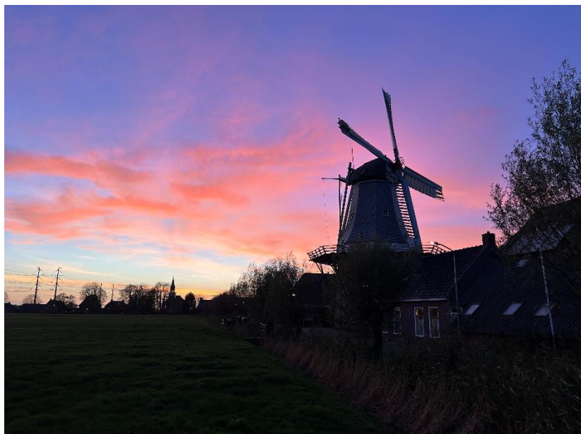
Beeld 1 Koren- en pelmolen De Wetsinger in Klein Wetsinge

De nu nog bestaande molens zijn zoals gezegd over het algemeen geen werktuigen meer met een economische functie, maar (rijks)monumentale vertegenwoordigers van een bijzonder verleden, die bovendien nog veelal als vanouds hun taak kunnen uitoefenen. Sterker nog: enkele molens hebben nog steeds een functie in de keten van voedselproductie of waterhuishouding. Dat maakt de molens tot bijzondere gebouwen die het waard zijn gekoesterd te worden en speciale zorg en aandacht verdienen, juist omdat molens om allerlei redenen zeer kwetsbaar zijn.