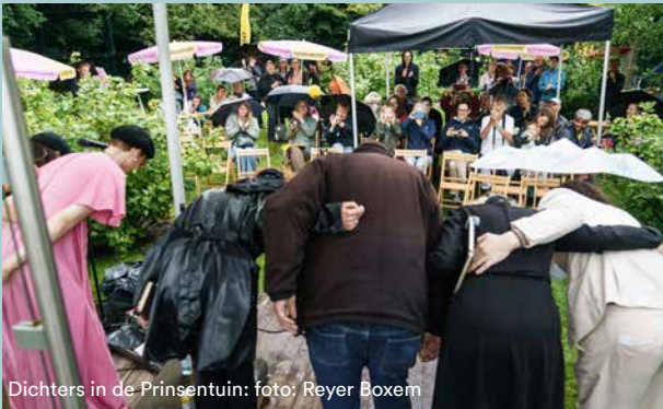
Dichters in de Prinsentuin: foto: Reyer Boxem