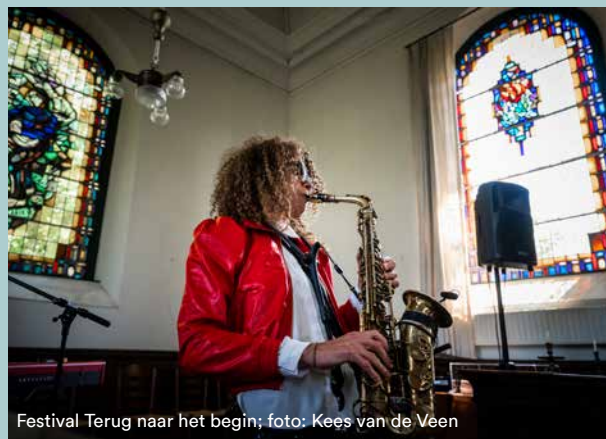
Festival Terug naar het begin; foto: Kees van de Veen

Steengoede artiesten in kerkjes vol verhalen. Als bezoeker rijg je op de fiets je eigen programma van intieme optredens aaneen, door de wierden en het erfgoed van Eemsdelta. Voor de 17e keer. Weids, lokaal en toch van ons allemaal. Meer via terugnaarhetbegin.nl .