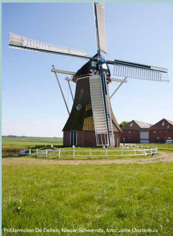
Poldermolen De Dellen, Nieuw-Scheemda

tijdperk. Zijn visualisaties zijn te zien in het Bezoekerscentrum Reitdiep van het Groninger Landschap — en de molens zelf maken deel uit van een fietsroute. Kijken én fietsen dus. Meer via groningerlandschap.nl .