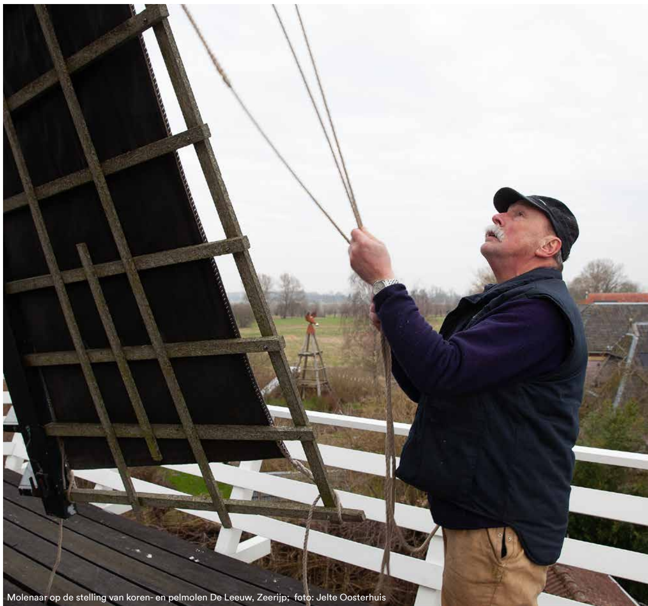
Molenaar op de stelling van koren- en pelmolen De Leeuw, Zeerijp