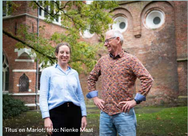
Titus en Marlot

Stap op de fiets en ontdek vijf bijzondere molens op het Hogeland – met een podcast als reisgezel. Bij elke molen vind je een QR-code die je verbindt met een aflevering van ongeveer tien minuten, gemaakt door podcastmaker Tom Tieman. Zo hoor je onderweg het verhaal van de Aeolus in Adorp, De Wetsinger in Klein Wetsinge, De Vriendschap in Winsum, De Jonge Hendrik in Den Andel en De David in Warffum. De route is in één keer te fietsen of in etappes. Podcast en route zijn vanaf 12 juni beschikbaar via erfgoedingroningen.nl .