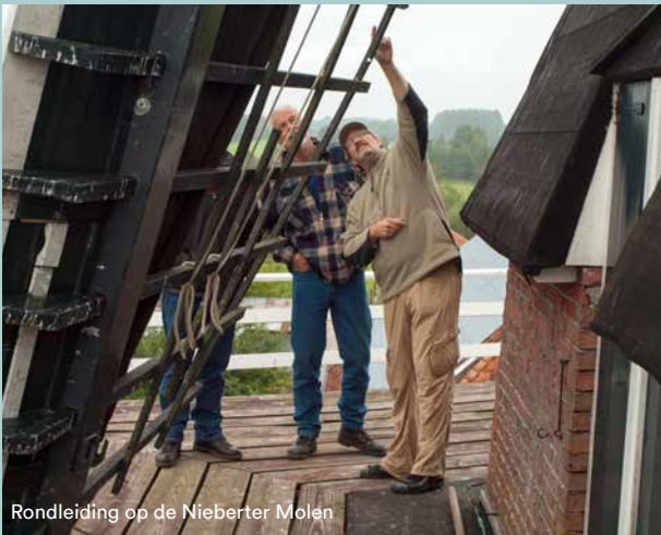
Rondleiding op de Nieberter Molen

Molens horen bij ons landschap. Maar zonder mensen die er om geven, zouden ze langzaam maar zeker vervallen. Houtworm en andere kleine knagers grijpen al hun kans als de wieken te lang stilstaan. Het zijn de molenaars en molengidsen — vakkundige vrijwilligers — die ervoor zorgen dat de molen blijft draaien en een bruisend onderdeel van dorp en gemeenschap blijft.