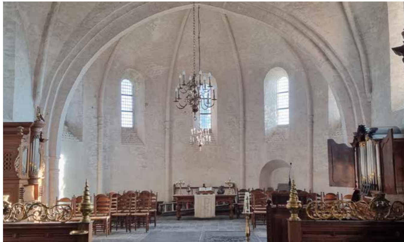
Koor van de Petruskerk Leens

De selectie start traditioneel met jong talent. En die generatie is sterker dan ooit: een golf