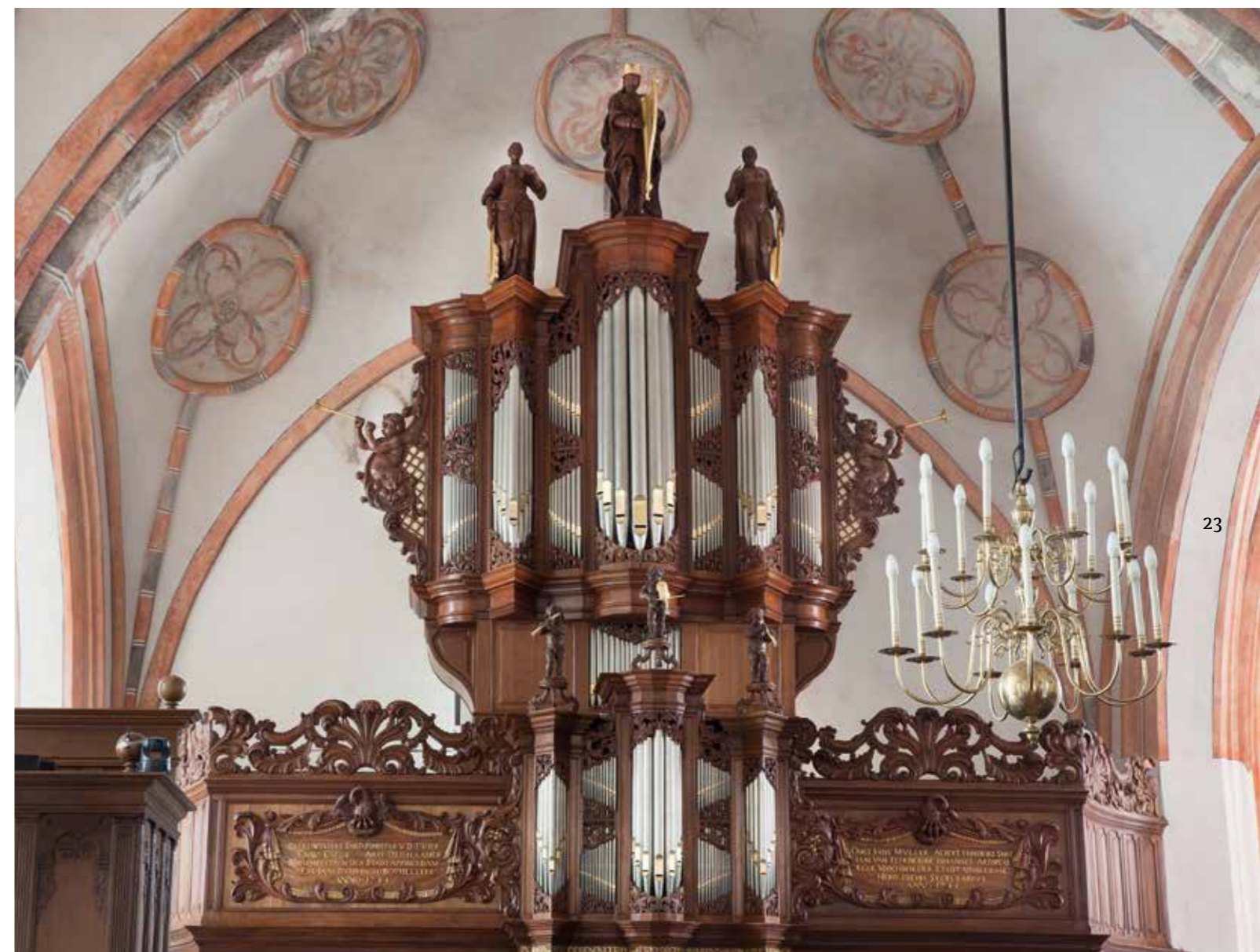
Het orgel in de Nicolaïkerk in Appingedam; foto: Jelte Oosterhuis >