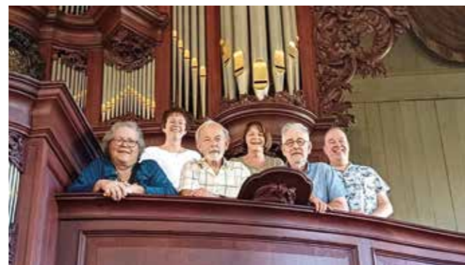
Boven: v.l.n.r. Dorpskerk Midwolda; Kerk Nieuwolda; Kerk Oostwold; Onder: v.l.n.r. Da Vida Beilen; Team Muziek en Monument