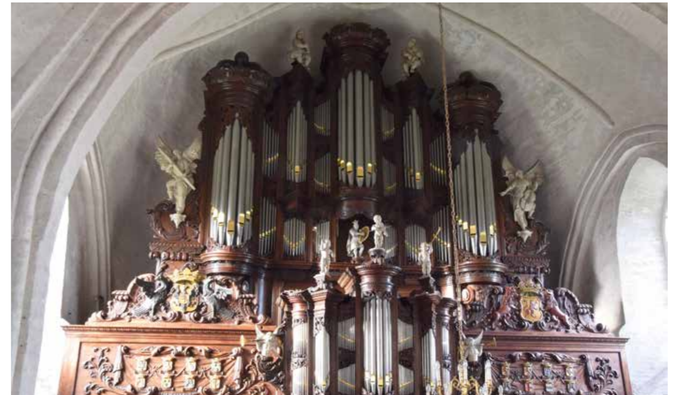
Hinszorgel van de Petruskerk Leens; foto: archief Erfgoed in Groningen