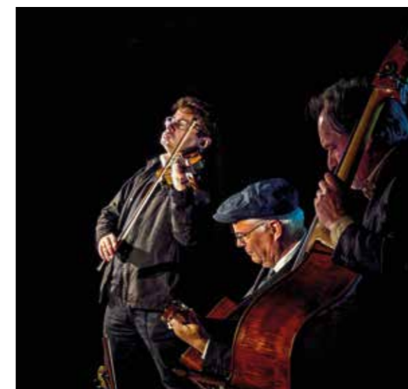
Bolotny Trio