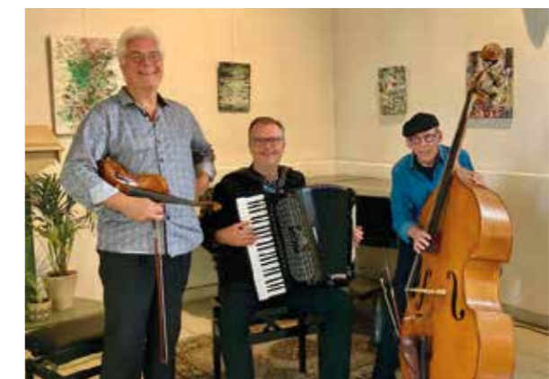
Drie Sterren Trio

Het ensemble Da Vida brengt muzikale impressies en verhalen uit verschillende landen en tijden. Met twee violen, luit, zang en percussie nemen de musici het publiek mee naar van een 17 e eeuwse balzaal naar een dorpsfeest in Slowakije. Het repertoire varieert van Dowland tot Rebetiko, van eigen nummers tot traditionele Balkanliederen. Soms ontroerend, dan weer vrolijk en meeslepend: voor de duur van dit concert verkeer je even in een andere wereld.