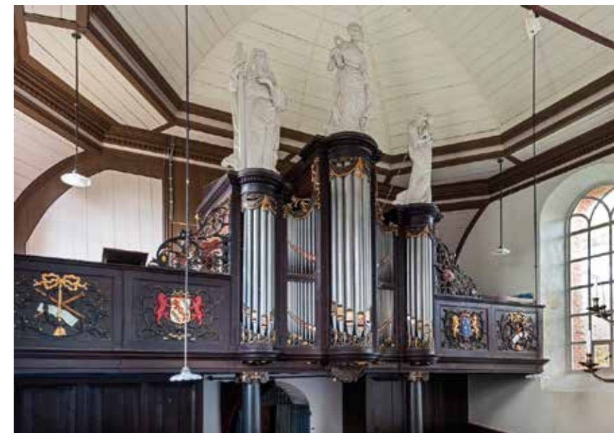
Van Damorgel

Om de drempel zo laag mogelijk te houden, is de toegang gratis. Het doel hiervan is om het orgel als veelzijdig muziekinstrument meer onder de muzikale aandacht te brengen. Iedereen kan zo even binnenlopen om te genieten van de veelzijdige orgelklanken.