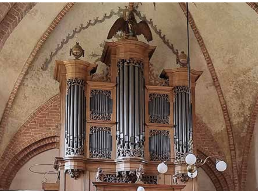
Orgel Bartholomeüskerk Stedum; foto: Stef Tuinstra

hervgembourtange.nl kerkeenrum.nl/algemeen kerkhornhuizen.nl/algemeen groningerkerken.wordpress.com/2026/01/28/van-huis-naar-kerkorgel/schnitgerorgelpeize.com Kerk Spijk | Algemene informatie bartholomeuskerkstedum.nl kerkzeerijp.nl/algemeen