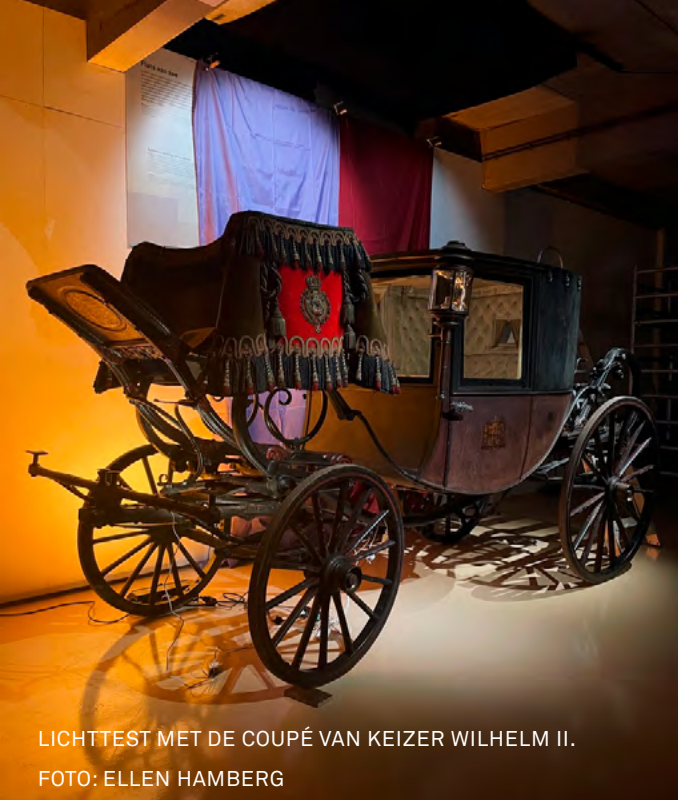
LICHTTEST MET DE COUPÉ VAN KEIZER WILHELM II.

ik, die deze ontwikkelingen ondergingen.