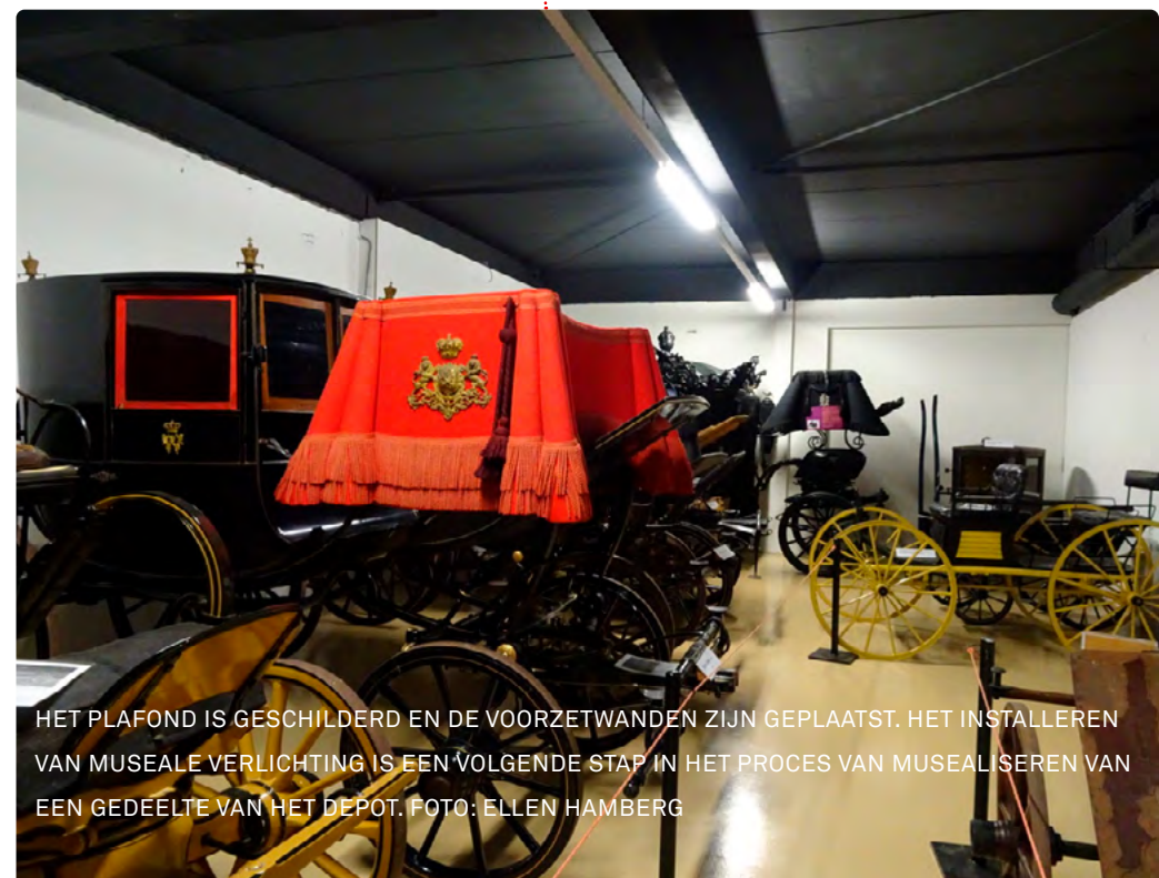
HET PLAFOND IS GESCHILDERD EN DE VOORZETWANDEN ZIJN GEPLAATST. HET INSTALLEREN VAN MUSEALE VERLICHTING IS EEN VOLGENDE STAP IN HET PROCES VAN MUSEALISEREN VAN EEN GEDÉEELTE VAN HET DEPOT.