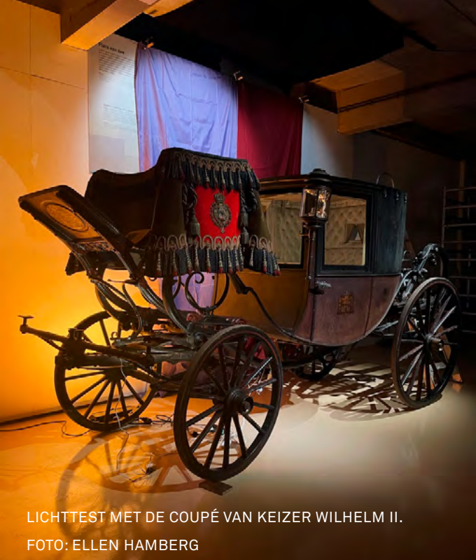
LICHTTEST MET DE COUPÉ VAN KEIZER WILHELM II.

ik, die deze ontwikkelingen ondergingen.