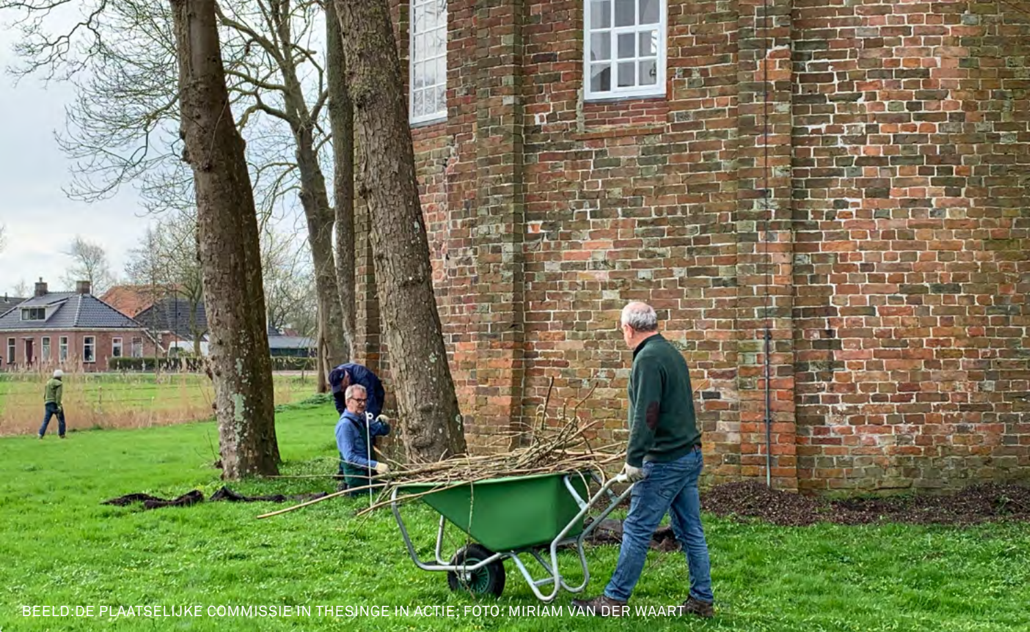
BEELD: DE PLAATSELIJKE COMMISSIE IN THESINGE IN ACTIE

het kerkhof of soms zelfs óp de kerk, zorgden voor vlees. Bovendien bracht de duivenmest het nodige op. Een opmerkelijk overblijfsel van het benutten van de natuurlijke omgeving is te vinden in Engelbert. De pastoor daar ving in de late middeleeuwen jonge spreuwen voor in de pastei of soep – de gaten voor de ‘spreuwenpotten’ zitten er nog in de kerkmuur. Oldambtster kerken hadden in de achttiende eeuw inkomsten uit het ‘iemengeld’ (ieme = Gronings voor bij) dat betaald moest worden voor het plaatsen van bijenkorven in de nabijheid van de koolzaadvelden in de nog jonge Dollardpolders. De voorbeelden van een vergeten, soms ook verdwenen wereld zijn legio.