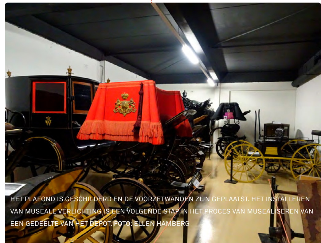
HET PLAFOND IS GESCHILDERD EN DE VOORZETWANDEN ZIJN GEPLAATST. HET INSTALLEREN VAN MUSEALE VERLICHTING IS EEN VOLGENDE STAP IN HET PROCES VAN MUSEALISEREN VAN EEN GEDÉEELTE VAN HET DEPOT.