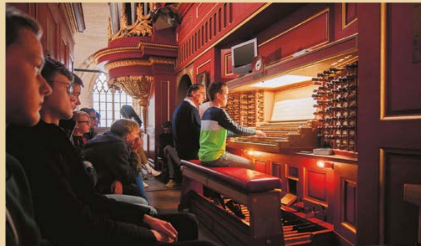
Jonge organisten

Inmiddels loopt StayTuned als een trein. Het idee is eenvoudig: een paar keer per jaar zijn tieners welkom bij enkele van de prachtige orgels van Nederland. Instrumenten die normaal op slot zijn, gaan