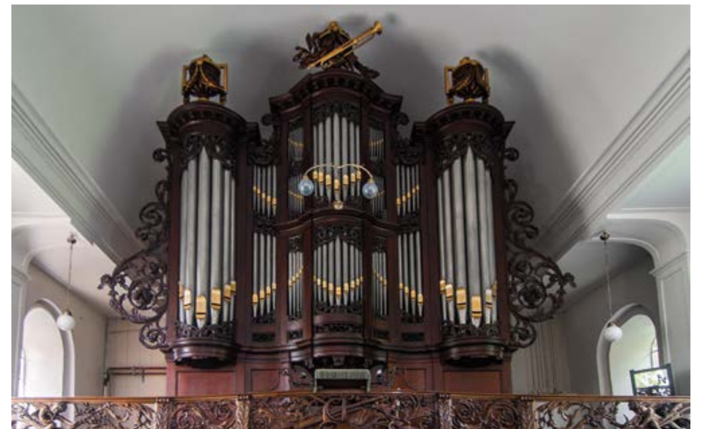
Sebastianuskerk Warffum