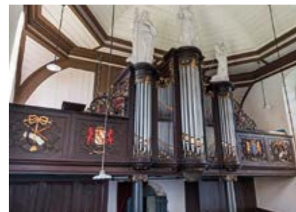
Van Damorgel Garnwerd

In 1867 werd het orgel opgeknapt door orgelbouwer Petrus van Oeckelen. Het orgelfront kreeg toen nieuwe frontpijpen. Tijdens die opknopbeurt door Van Oeckelen werden ook de drie bas-reliëfs op het orgel geplaatst, die symbool staan voor geloof, hoop en liefde. In 1986 is het orgel, dat toen grotendeels onbespeelbaar was, onder handen genomen door orgelbouwer Mense Ruyter, onder regie van orgelkundige en organist Klaas Bolt. In de jaren 2019 en 2020 werd het orgel opnieuw gerestaureerd.