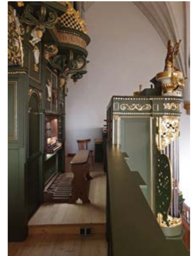
De Mare-Hinszorgel Loppersum

Van 28 juli tot en met 3 augustus 2024 vindt voor de derde keer de International Martini Organ Competition Groningen plaats (IMOCCG). De orgelwedstrijd gaat langs verschillende orgels. De Mare-Hinsz-orgel in