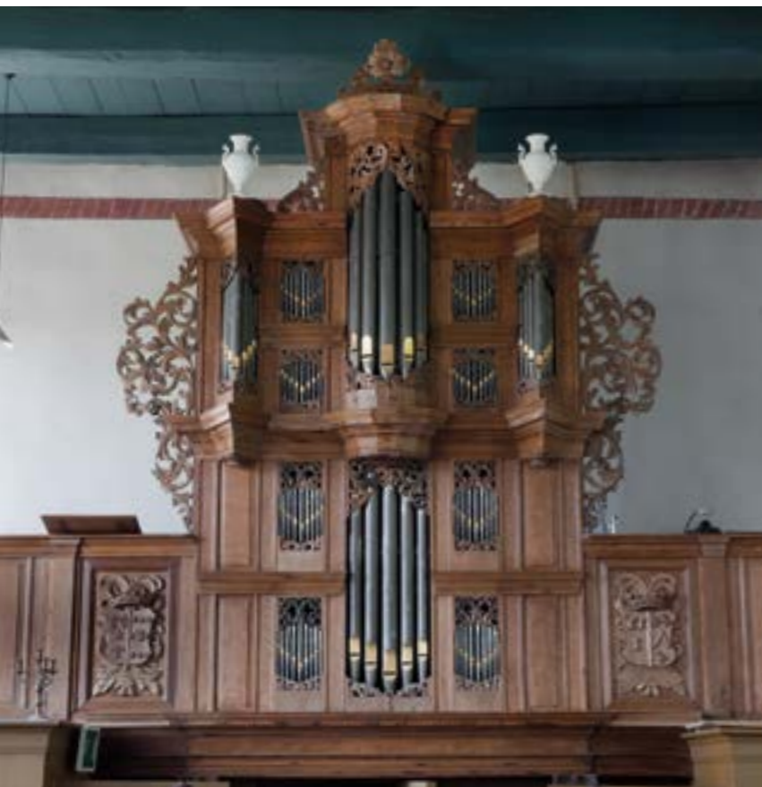
Schnitgerorgel Eenum

Verder naar het oosten, tegen de Eems aan, ligt Farmsum. In de hervormde kerk staan twee orgels: het Meijerorgel (koororgel) en het hoofdorgel: het beroemde Lohmanorgel. Orgelbouwer Nicolaas Antonie Lohman vervaardigde het orgel in 1829. Het is niet alleen een genoegen om het orgel te beluisteren, maar ook om het te aanschouwen, vanwege het sierlijke houtsnijwerk aan het orgelfront van Anthonie Walles (1790-1845) en de gipsen