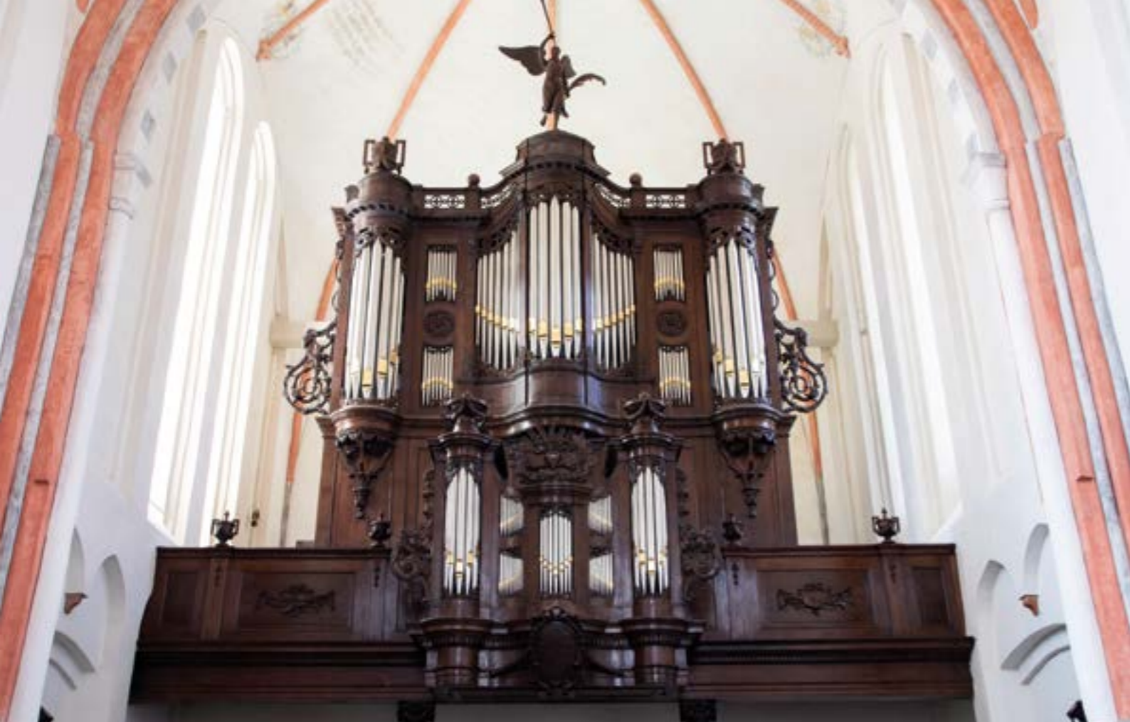
Orgel Zuidbroek