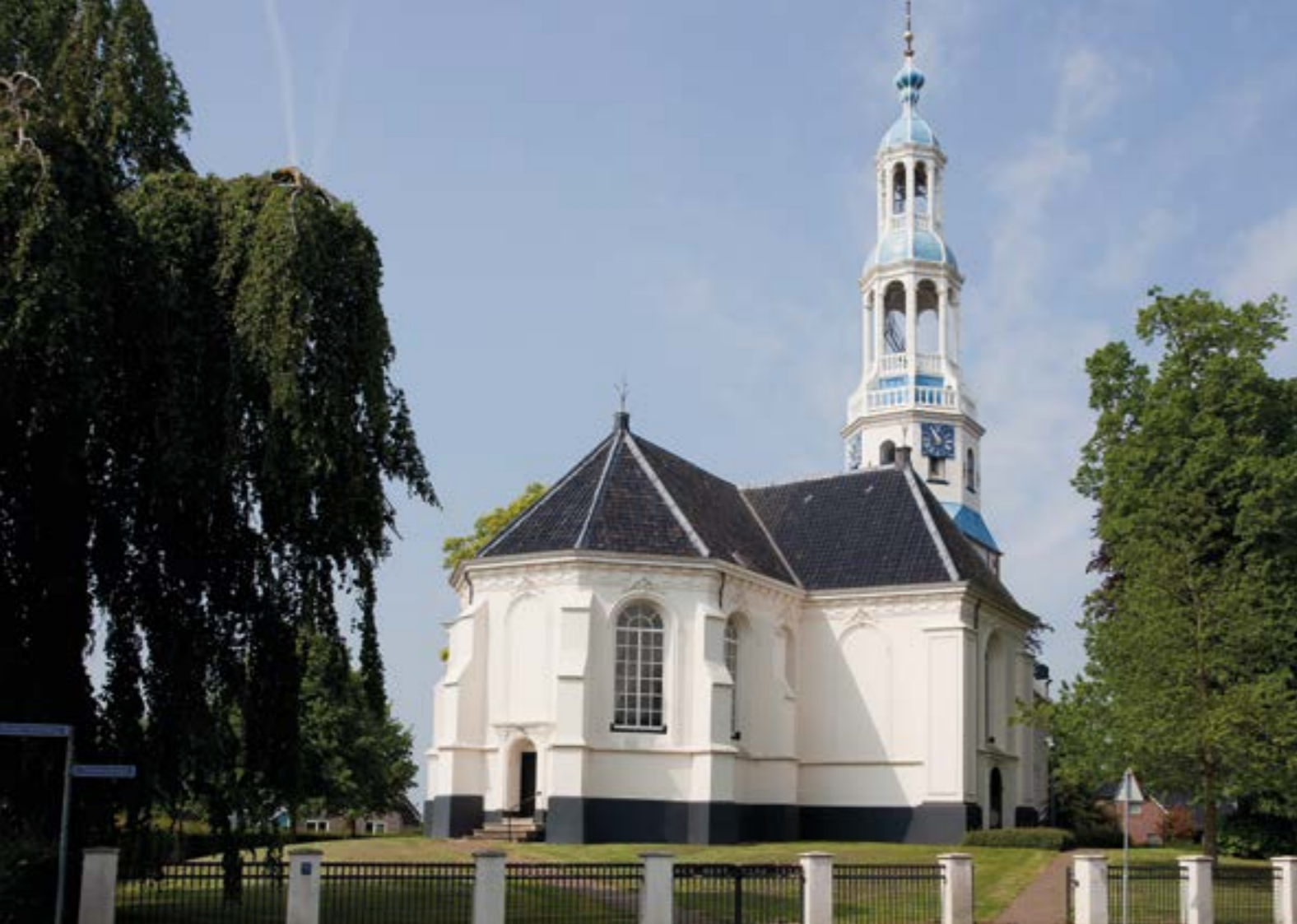
Mariakerk Uithuizermeeden