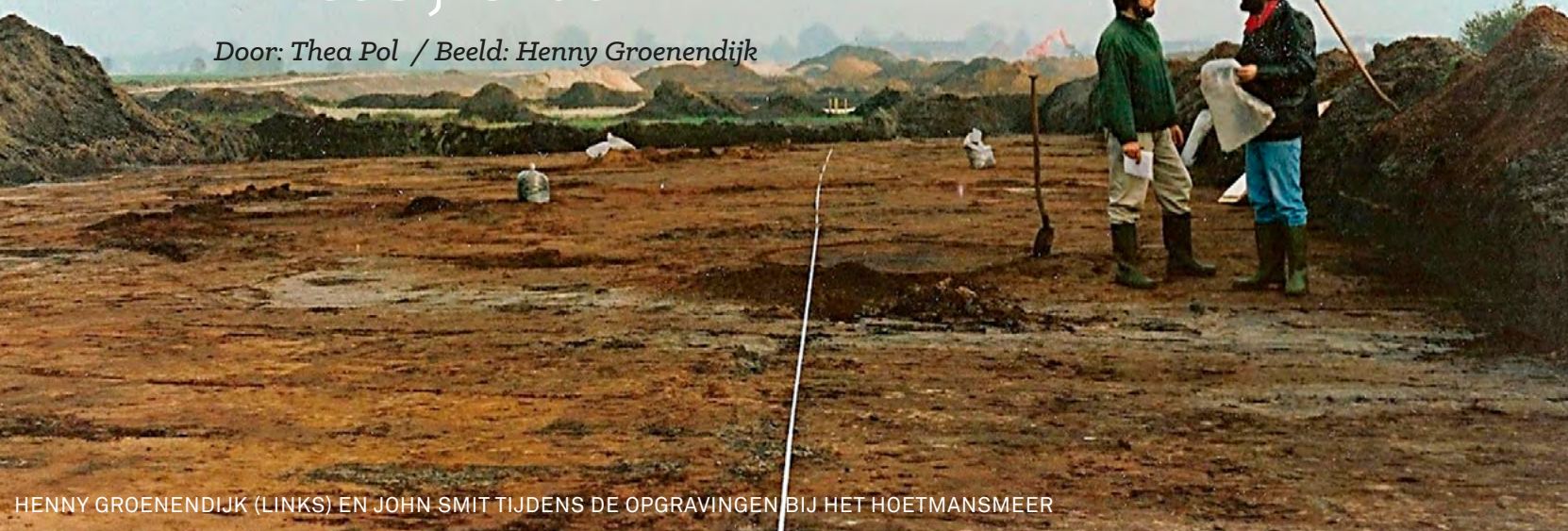
HENNY GROENENDIJK (LINKS) EN JOHN SMIT TIJDENS DE OPGRAVINGEN BIJ HET HOETMANSMEER

Door: Thea Pol