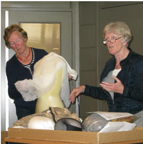
Vrijwilligers Groninger Dracht van de borg Verhildersum

Als je in Groningen woont, leef je automatisch samen met cultuur. Maar door mijnbouwschade en de leegloop van het platteland staat de beleving hiervan onder druk. Binnen de Gemeenschappelijke Agenda wil Erfgoedpartners zich samen met de andere steuninstellingen sterk maken om de culturele voorzieningen in Groningen bereikbaar te houden voor inwoners van stad en provincie. Door de gemeentelijke herindeling worden gemeenten ook steeds meer partners in dit proces. Samen met gemeenten en provincie willen we werken aan een goed netwerk van culturele voorzieningen en een goede ondersteuning van de erfgoedinstellingen.